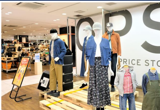
8月29日(土)にオープンした浅草 ROX 店

オフプライスストアは、各々のブランドが単独で展開するアウトレット業態とは異なり、商品のクオリティーとバリエーションを重視してセレクトされた多種多様なブランドを、鮮度が高い状態で購入できる店舗(空間)です。