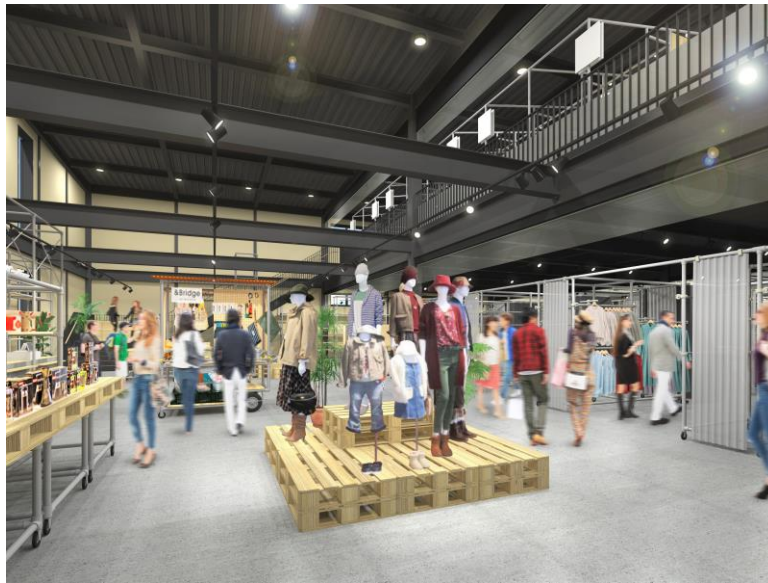
「アンドブリッジ」ニューポートひたちなか店（茨城県ひたちなか市新光町 35 番地） ジョイフル本田ニューポートひたちなか店敷地内に、2 階建て 450 坪でオープン

まだ鮮度のあるファッションの余剰在庫を、様々なメーカーからセレクトしてひとつの店内で販売をする“オフプライスストア”。そのオフプライスストアの先駆けである「&Bridge(アンドブリッジ)」の最大店舗が3月13日(土)、(株)ジョイフル本田(本社:茨城県土浦市)が運営するジョイフル本田ニューポートひたちなか店敷地内にオープンします。